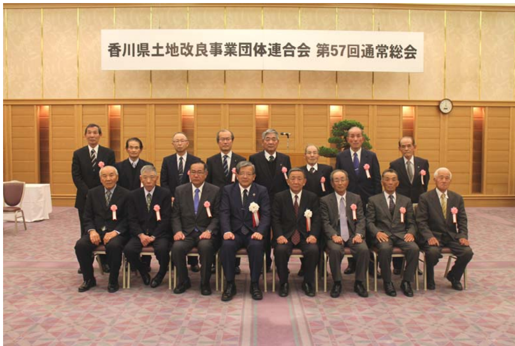
香川県職員表彰者名簿