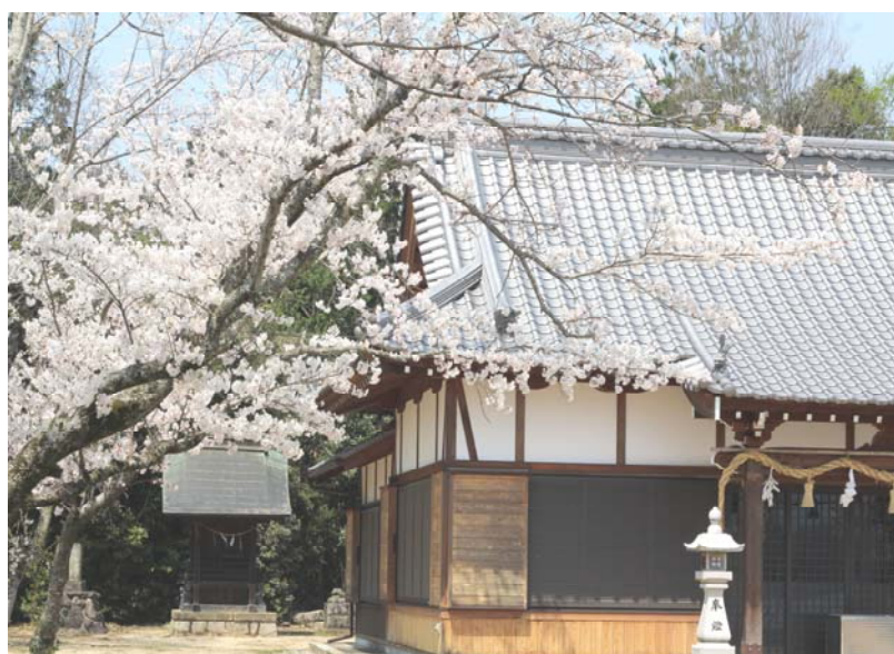
神野神社（仲多度郡まんのう町）