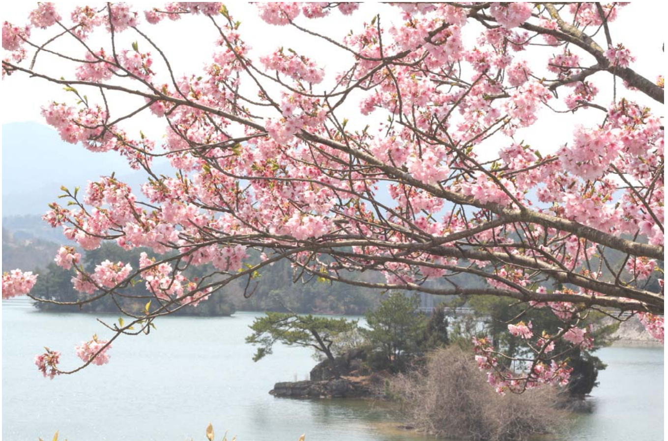
満濃池（仲多度郡まんのう町）

発行所 香川県土地改良事業団体連合会 高松市番町 2 丁目 4 番 27-301 号 TEL (087) 822-0303 FAX (087) 851-1787 http://www.midorinet-kagawa.or.jp/