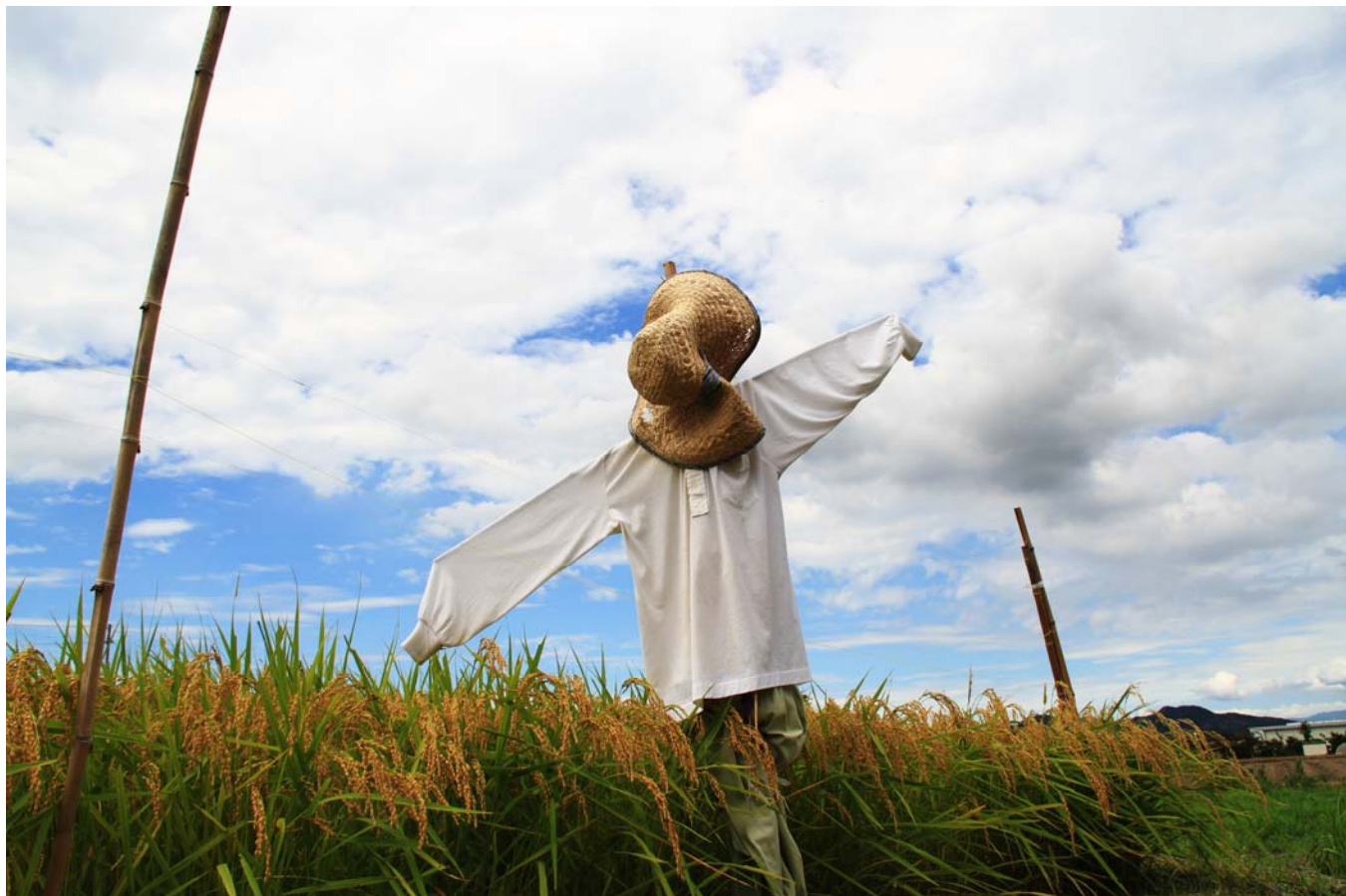
案山子（木田郡三木町）