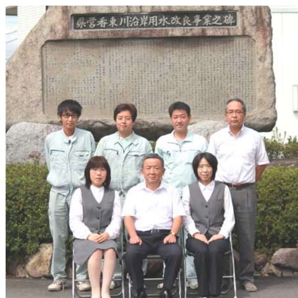
三笠理事長（前列中央）と職員